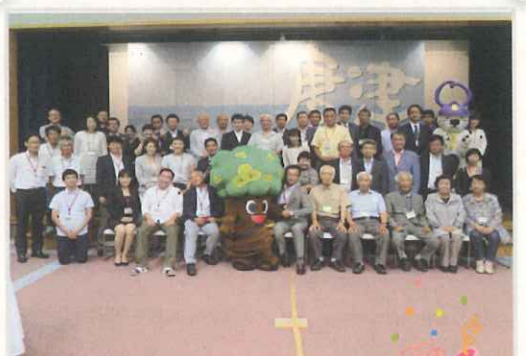
6月11日(土)10周年記念式典! 皆様に、感謝! 感謝!