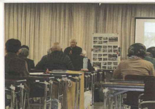
唐津市うみ・やま・かわ環境調和のまちづくり事業で23団体の活動をサポート