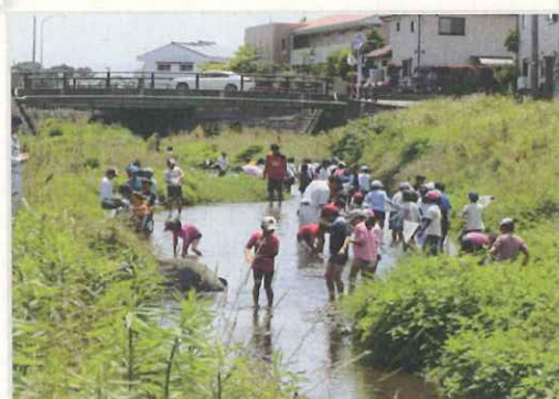
6月14日(火)長松小学校4年生と一緒に 町田川の環境しらべ!