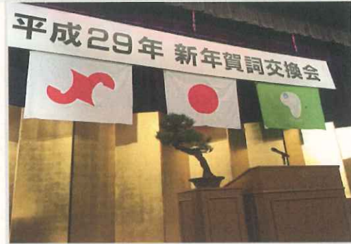
1月4日(水)賀詞交換会に招待していただきました。