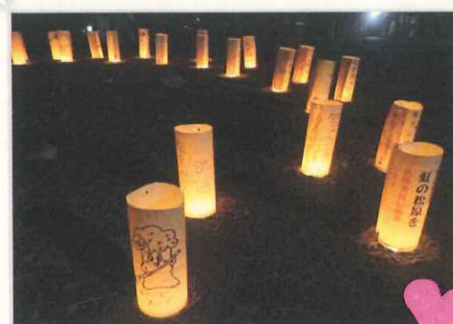
6月25日(土)三保の松原との交流事業 「あかりともるよる」に参加