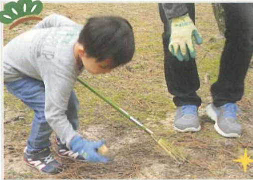
4月3日(土)幻のキノコ「ショウロ」探し! 84個のショウロが見つかりました!