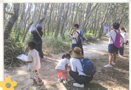
8月の土曜、日曜日に「虹の松原探検 ゲーム!」を開催!