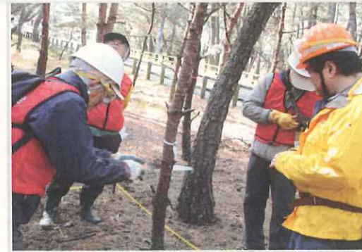
2月18日(土)初・除伐体験！ 林内に光が差し込みます！