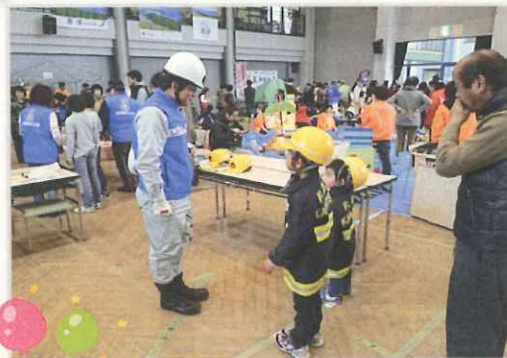
2月5日(日)環境防災ネットワーク博覧会～かんねまつり～800人もの来場者！