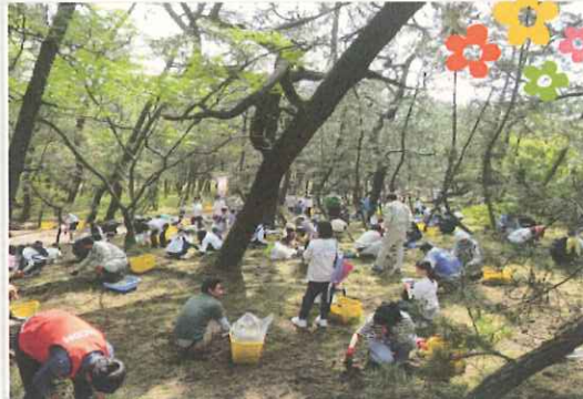
5月15日(日)KPP! 最多参加者タイの 約300人のみなさんと一緒に活動!