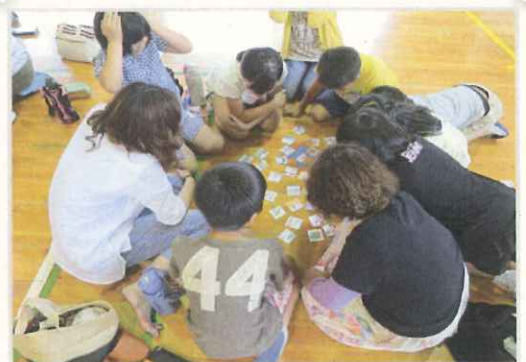
6月16日(木)鏡山小学校4年生の親子 レクでオリジナルエコカルタ大会!