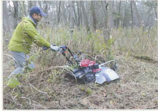
10月歩行式草刈機導入！手つかずの場所の草を刈りました！（約7ha）