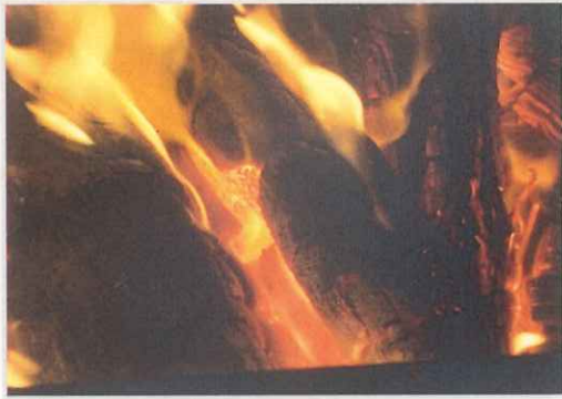
松竹薪！副産物(松葉、枯れ枝)の活用に向けて、1歩前進！！