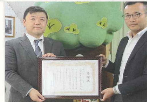
3月2日(水)あいおいニッセイ同和損保様より寄付金をいただきました！